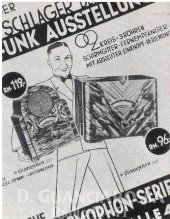
1933 - Le prime pubblicità della Braun tedesca della sua serie Cosmophon. Per la fiera di Berlino.

Scritto da David Guanciarossa Lunedì 15 Giugno 2009 14:54 -