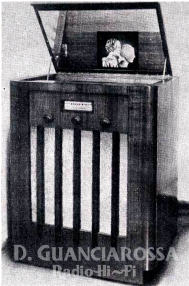
1934 - Mobile ricevitore televisivo della Telefunken.