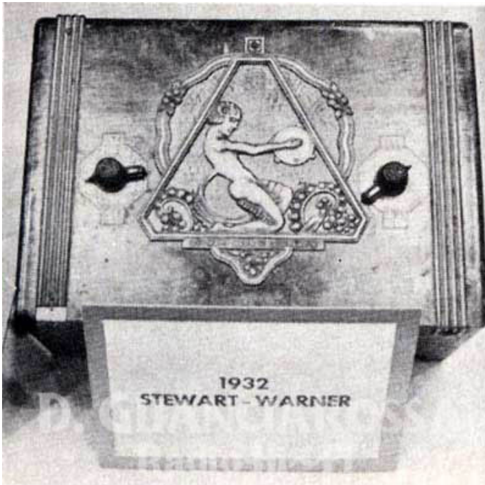
1932 - Radio artistica della Stewart Warner Companion.