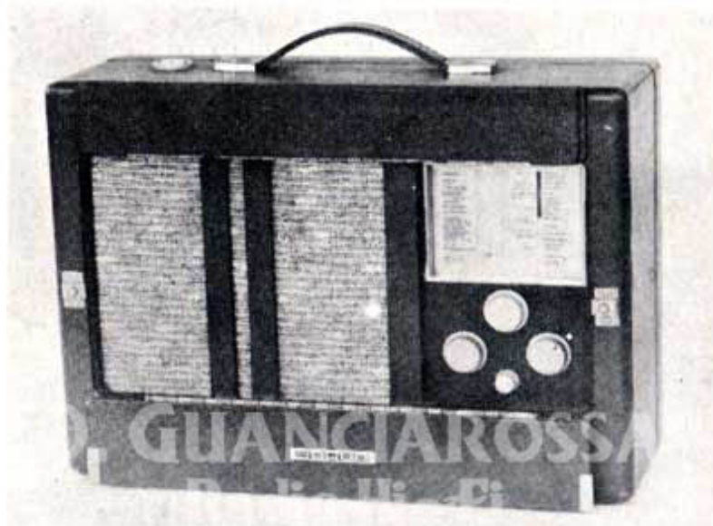
1938 - La prima radio portatile multionde. Della Braun modello BSK 238 D. Il capolavoro della Braun. U