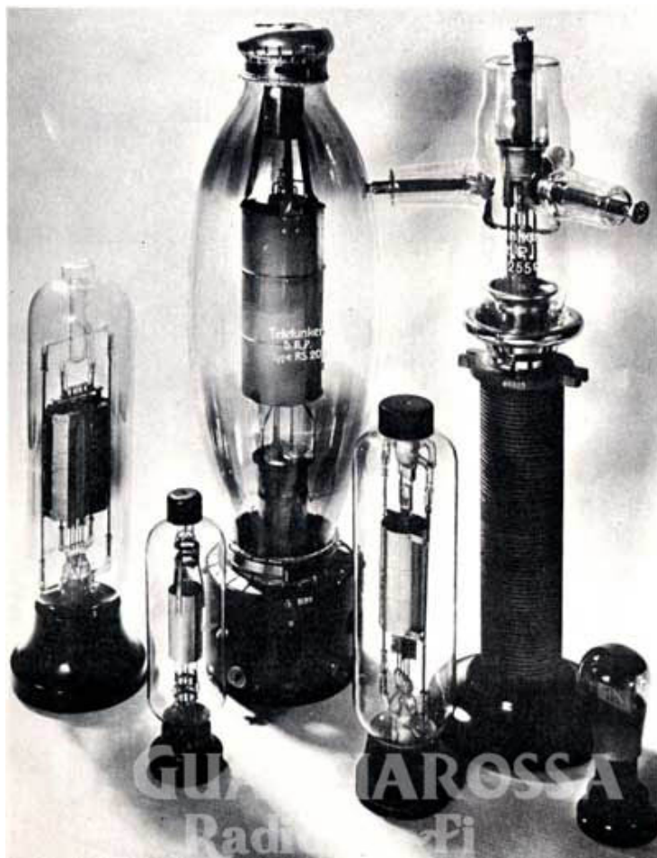
1935 - Le storiche valvole trasmettenti della Telefunken. Modelli dal 1920 - 1935